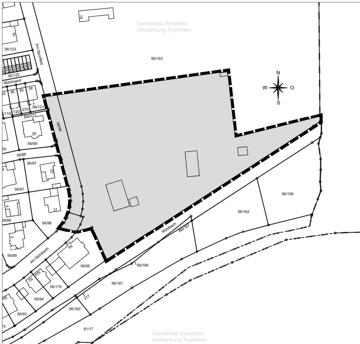
Umriss 4. Änderung des Bebauungsplanes „Mühlmahd“ (ohne Maßstab)

Die Gemeinde Aystetten hat mit Beschluss des Gemeinderates vom 23.04.2026 die 4. Änderung des Bebauungsplanes „Mühlmahd“, bestehend aus der Planzeichnung (Teil A) und dem Textteil (Teil B), jeweils in der Fassung vom 23.04.2026, als Satzung beschlossen. Die Begründung (Teil C), ebenfalls in der Fassung vom 23.04.2026, wurde als Bestandteil der 4. Änderung des Bebauungsplanes „Mühlmahd“ gebilligt. Die 4. Änderung des Bebauungsplanes „Mühlmahd“ umfasst Teilflächen der Grundstücke Flur Nrn. 56/8 (Am Mühlbach), 56/98 (Am Sportfeld) und 56/153, jeweils Gemarkung Aystetten, zwischen der Straße Am Sportfeld (teilweise einschließlich), der Tennisanlage des TC Rot Weiß Aystetten, der Sportanlage des SC Cosmos Aystetten und dem Mühlbach im Südosten der Ortslage Aystetten.